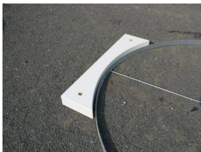
OBRÁZEK 1: ODPALÍŠTĚ VRHU KOULÍ

Sportoviště bude odvodněno hloubkovými šterkovými drenážemi. Drenážní pera DN 100 z částečně perforovaných PP trubek budou umístěny příčně po 5 m, ve sklonu 0,5%, ukončena budou v podélném hlavním DN 200, který bude sveden retenční nádrže a následně do vsakovací jímky v jižní části areálu na travnaté ploše.