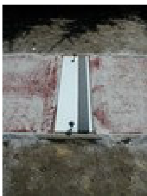
Obrázek 2 - odrazové břevno pro skok daleký,

Dále dojde k vybudování nového běžeckého oválu délky 331,5 m s běžeckou rovinkou 120 m, dráhy šířky 1250 mm, celkové šířky oválu 4,36 m, a s doskočištěm pro skok daleký. Plocha bude tvořena z polyuretanového vodopropustného povrchu EPDM tl. 2 - 3 mm, pod nímž se nachází vodopropustná pružná podložka tl. 10 mm směs černého SBR granulátu fr. 1 - 4 mm a pojiva, položená na souvrství drenážních asfaltů (40+50 mm). Pro skok daleký je potřeba osazení odrazového břevna s protiskluzovým pásem, celkové šířky 100 mm.